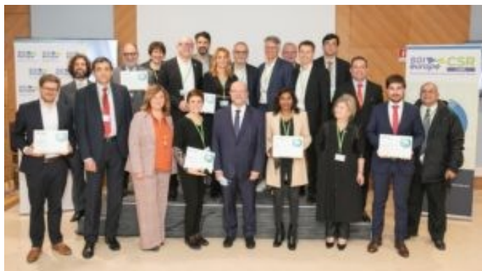
Les lauréats du label RSE 2022

Depuis sa création, le label RSE de SGI Europe démontre dans toute l'Union Européenne une véritable prise de conscience de la part des entreprises et employeurs de services publics quant à l'impact de leurs activités sur la société et l'environnement.