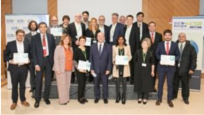
Les lauréats du label RSE 2022

Depuis sa création, le label RSE de SGI Europe démontre dans toute l'Union Européenne une véritable prise de conscience de la part des entreprises et employeurs de services publics quant à l'impact de leurs activités sur la société et l'environnement.