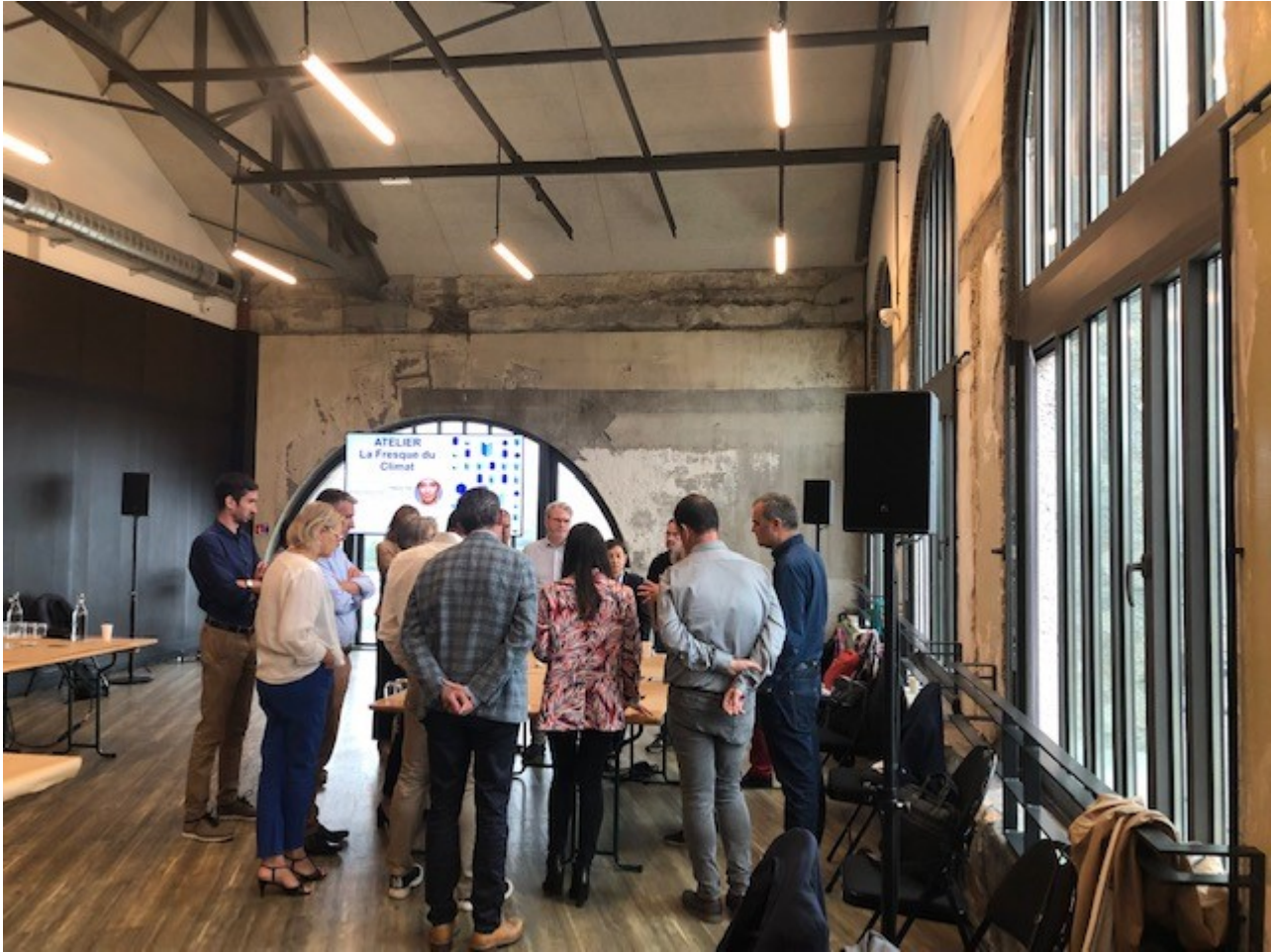
J2 fresque du climat 2