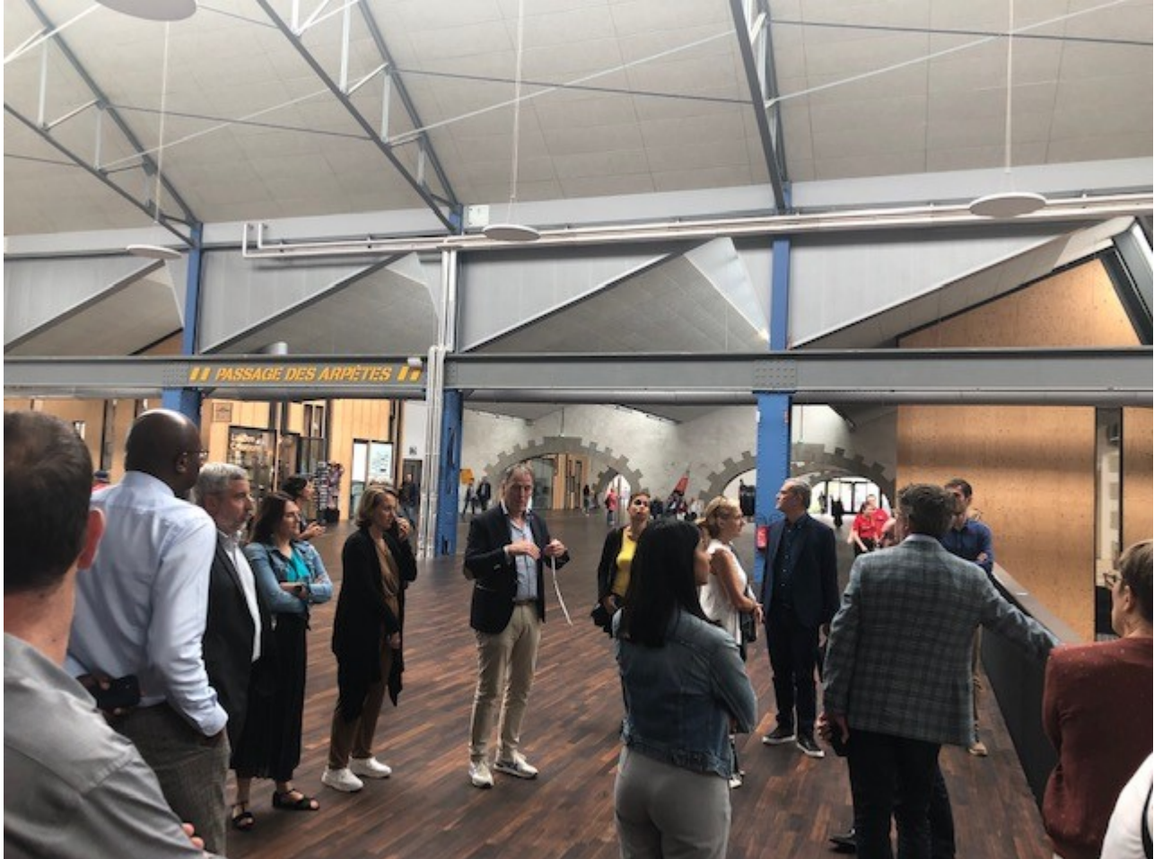
Visite de l'Ateliers des Capucins