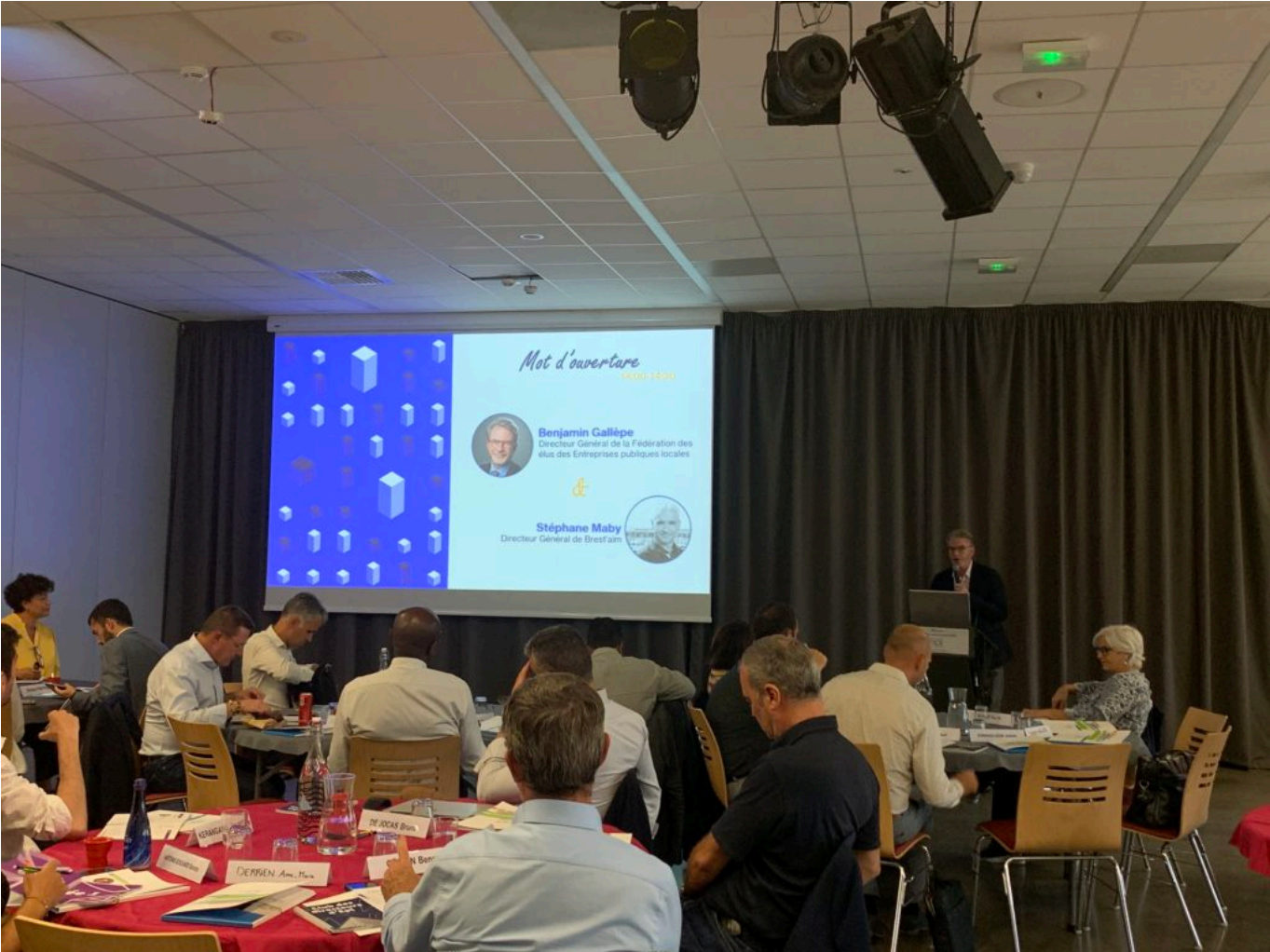
Seminaire RSE BG