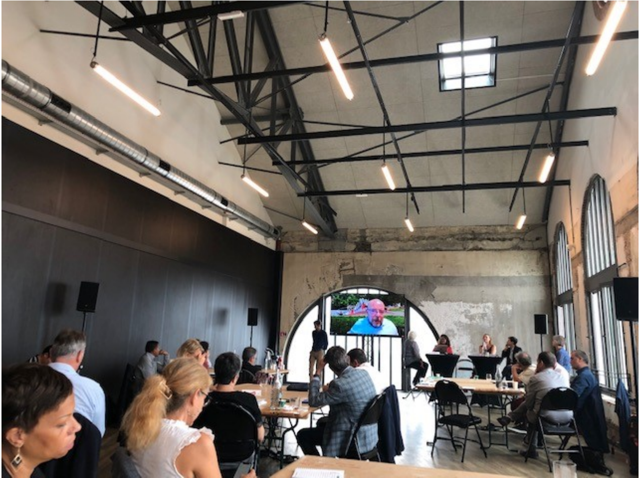
J2 Retour d'experience Epl