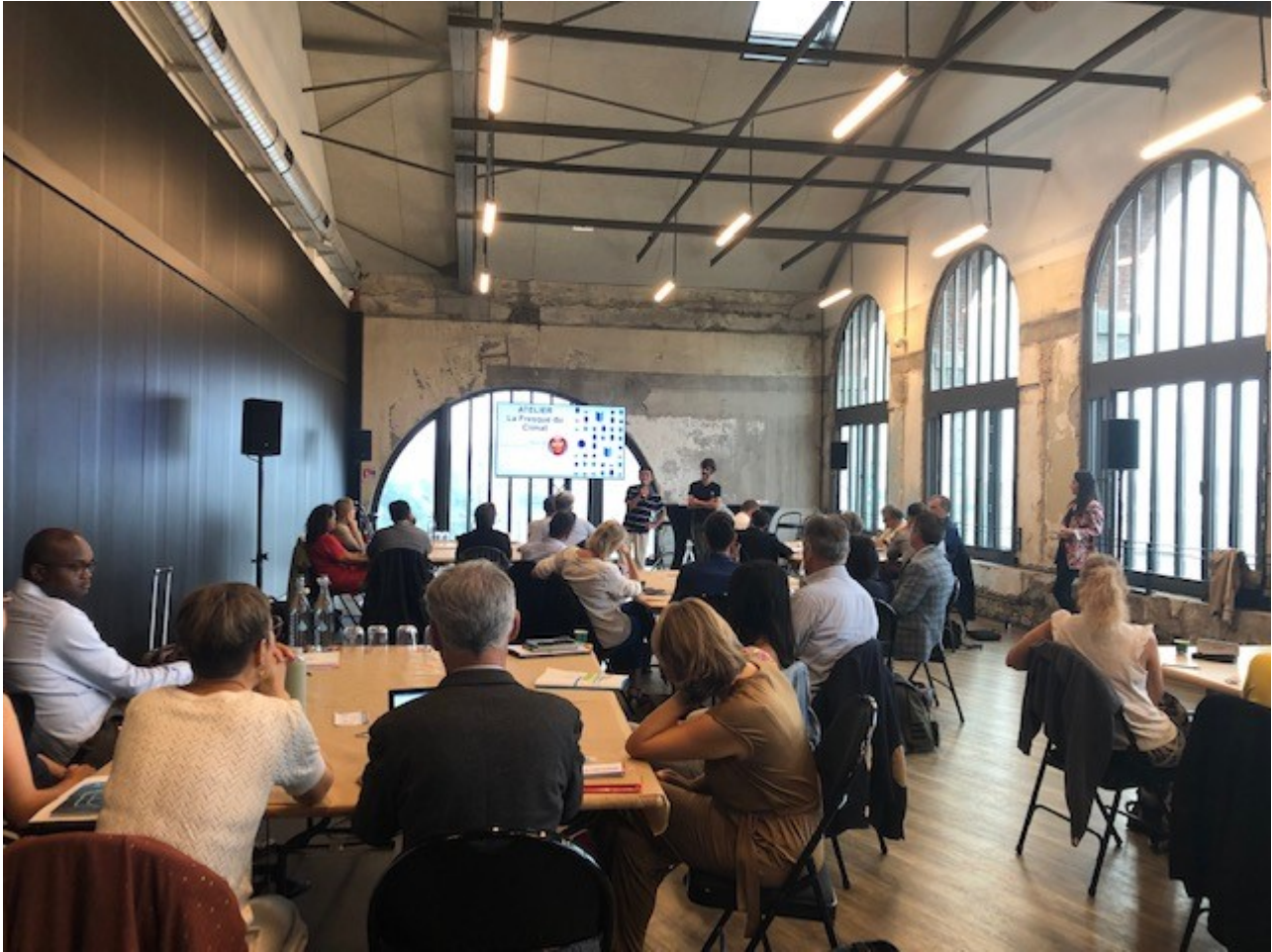
J2 Ateliers des Capucins 2